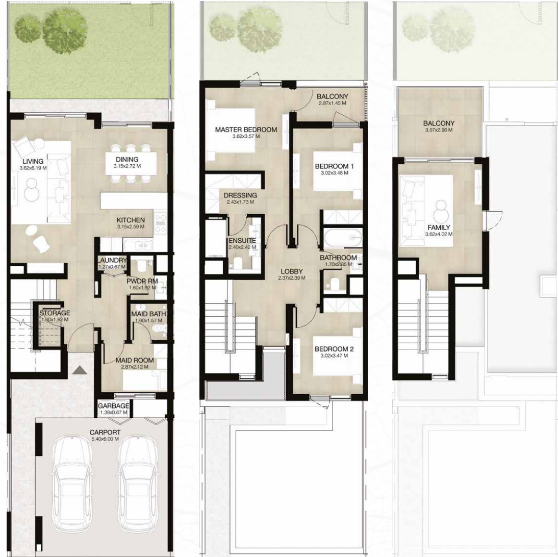
GROUND LEVEL الطابق الأرضي FIRST LEVEL الطابق الأول ROOF LEVEL السطح

3 غرف نوم + غرفة عائلية و غرفة خادمة - الوحدة المتوسطة