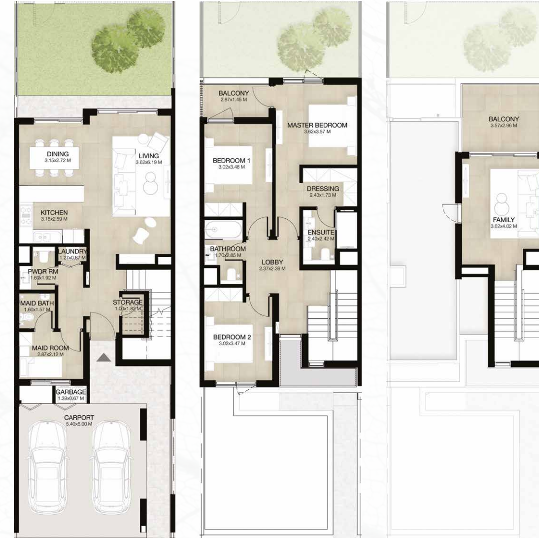
GROUND LEVEL الطابق الأرضي FIRST LEVEL الطابق الأول ROOF LEVEL السطح

3 غرف نوم + غرفة عائلية و غرفة خادمة - الوحدة المتوسطة (معكوسة)